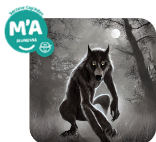
Pizza & loup-garou