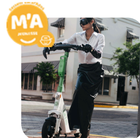
Rando trottinette électrique

RDV à 18h30 Antenne Saint Saturnin 12 places Tarif : de 3,54 € à 19,36 € Selon le quotient familial