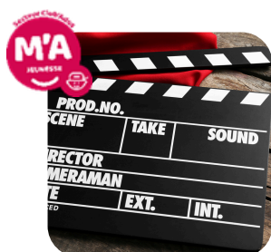
Plancha & film

RDV à 18h30 Antenne Vic-le-Comte 12 places Tarif : de 2,92 € à 7,85 € Selon le quotient familial