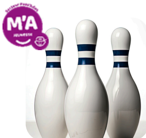
Bowling & buffet

RDV à 18h30 Antenne Martres de Veyre 12 places Tarif : de 2,92 € à 7,85 € Selon le quotient familial