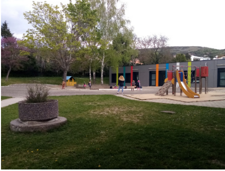
• Cour extérieure de l'ALSH