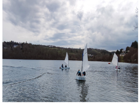
• Découverte de la voile au Lac d'Aydat