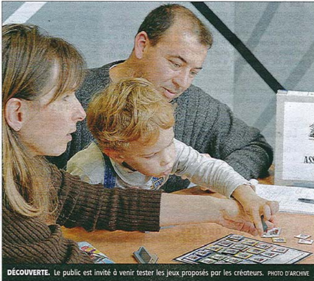
DÉCOUVERTE. Le public est invité à venir tester les jeux proposés par les créateurs. PHOTO D'ARCHIVE

Un week-end ludique et festif durant lequel la compétition est bel et bien présente