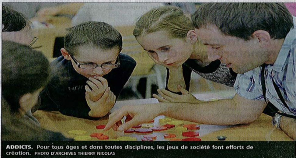
ADDICTS. Pour tous âges et dans toutes disciplines, les jeux de société font efforts de création.

ment ludique et tous ont droit de cité : jeux de guerre, de cartes, de découverte, d'histoire ou de légendes... Exception faite évidemment de l'expression vidéo car Ludix se veut promoteur des jeux de société au sens le plus étroit et le plus familial du terme. Autrement dit ceux qui exigent que l'on se