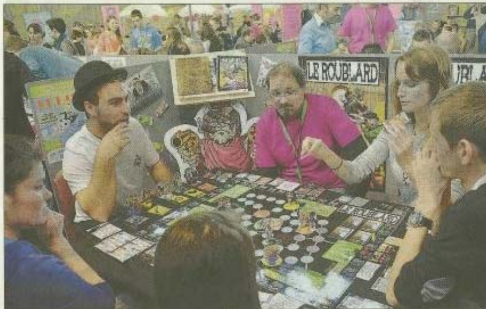
SURPRENANT. Des jeux très créatifs pour tous les goûts, sur tous les thèmes qui amusent grands et petits.

Les jeunes de la communauté de communes Gergovie-Val d'Allier, chapeautés par Olivier Faure, coordinateur du festival accueillent le public et in-