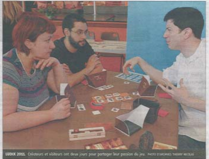
LUDIX 2011. Créateurs et visiteurs ont deux jours pour partager leur passion du jeu.

De son côté, le jury, constitué de spécialistes du monde du jeu