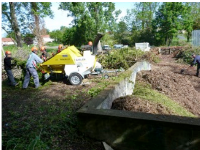
L'équipe de l'ASEVE au travail

Les usagers viennent se servir en broyat et développent des pratiques de compostage de qualité et de jardinage au naturel (paillage).