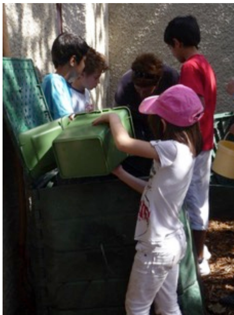
Des écoles déjà équipées, des projets à pérenniser

Une attention particulière sera donnée pour ces actions soient en lien avec les projets de compostage partagé développés sur les 3 communes.