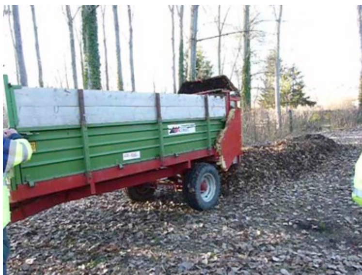
L'épandeur à fumier adapté pour le mélange des matière et la confection des andains

Cette première année d'expérimentation a permis d'ajuster les techniques et processus de compostage de tontes en andain.