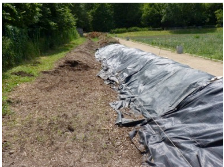
Compostage en bacs en compostage en andain