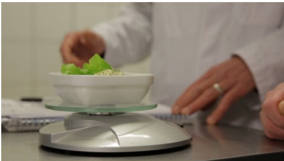
Des diagnostics précis en cuisine pour évaluer le gaspillage

En 2017-2018, les établissements scolaires volontaires auront la possibilité de se réinscrire au dispositif Etablissements Témoins du Valtom pour pérenniser leur projet.